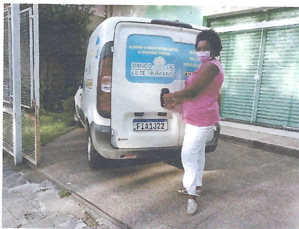
Taubaté – SP Na foto acima, auxiliar de enfermagem finalizando a rotina diária das visitas domiciliares às doadoras de leite humano.