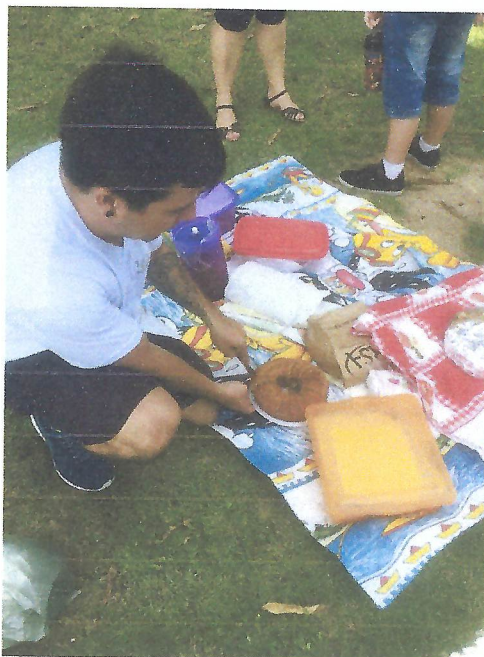
Taubaté – SP Na foto acima, orientação nutricional.