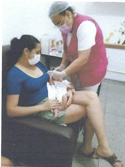
Taubaté –SP Na foto acima, auxiliar de enfermagem prestando orientações a uma mãe.