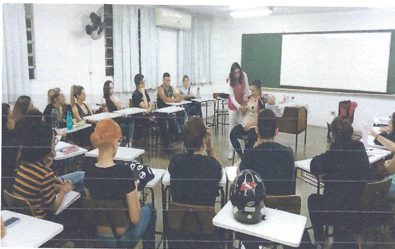
Taubaté – SP Na 1º foto acima, demonstração sobre aleitamento materno durante o curso para gestantes realizado na Casa da Criança. Na 2º foto, oficina sobre aleitamento materno para alunos de enfermagem da UNITAU.